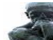
Tema del Mes... Minoría de edad y aborto

Congreso Nacional de la SEFH (Sociedad Española de Farmacia Hospitalaria), Tenerife 25/07/2007