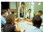
CONCURSO DE AYUDA a la FORMACION

En relación a la Incapacidad Temporal, y al tratarse de situaciones motivadas por problemas de salud que conllevan unas determinadas prestaciones de la Seguridad Social, se hace necesario que los médicos que han de certificarlas conozcan –además de los aspectos médicos correspondientes- las normas reguladoras de prestación, las repercusiones en el ámbito laboral, los requerimientos de tramitación, etc., algo que este curso pone a disposición de todos los profesionales interesados cualquiera que sea su lugar de residencia, gracias a su metodología on-line a través de la plataforma virtual de la FFOMC.