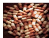
Señor Doctor... ¿ Podría usted curarme ?