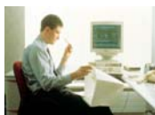
OFERTAS DE EMPLEO

Diccionario Multilingüe Traducciones y definiciones con Alexandria