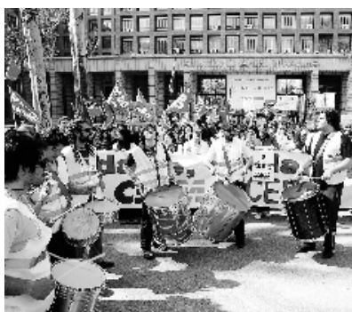
Los MIR se manifestaron el pasado sábado para pedir un descanso después de guardias de 24 horas

A pesar de que el ordenamiento jurídico prevé la posibilidad de que la Administración Pública atribuya a otros organismos públicos y privados la realización de actuaciones o la prestación de servicios públicos, el presidente de FAISS apunta que esta medida se encuentra «limitada» a los supuestos en los que la administración no pueda «por razones de eficacia» o «porque no se posean los medios adecuados». «No es la situación actual», matiza. Aunque, de momento, sólo han solicitado un entrevista con el Ministerio, no descartan recurrir a «otro tipo de medidas» para garantizar los «intereses de los ciudadanos».