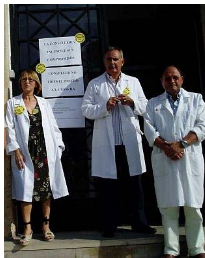
Imagen de la huelga de inspectores médicos y farmacéuticos, esta semana A. I.

"Estamos perdiendo dinero que debería destinarse a mejorar el servicio de inspección para garantizar así el control de las bajas y el cumplimiento de los objetivos marcados", consideran.